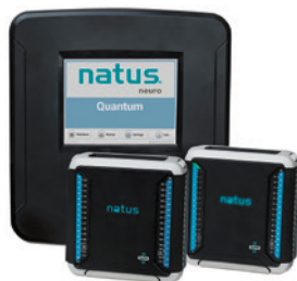
NEU! Quantum de Natus