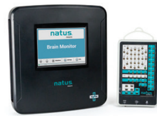
NEU! Natus Brain Monitor